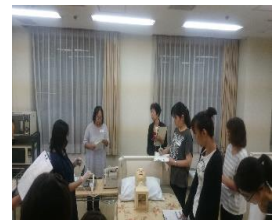
昨年度のスクーリングの様子