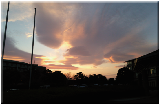
▲ 口フォス湘南から臨む夕焼け