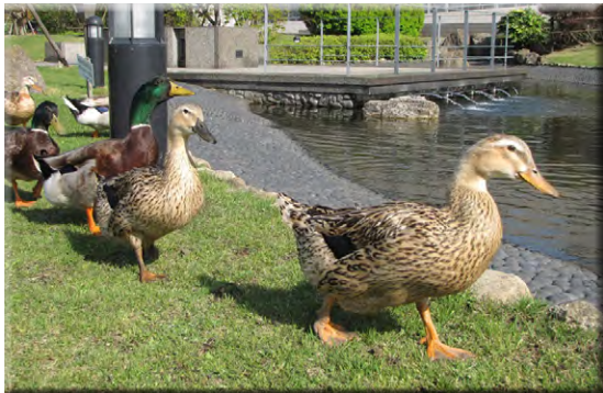
▲ロフォス湘南のアイドル鴨