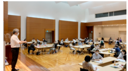
2日目の演習（ボカシ加工済）

仕事にはなじみのない分野の科目だったが、分かりやすいたとえ話をしてくれてよく理解できた。