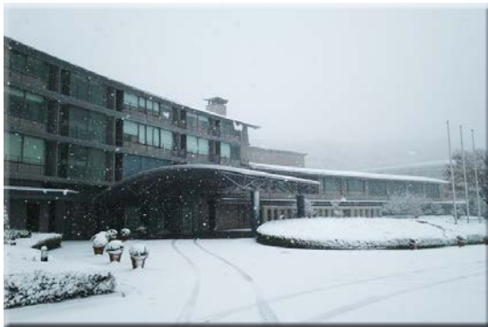
▲雪につつまれるロフォス湘南