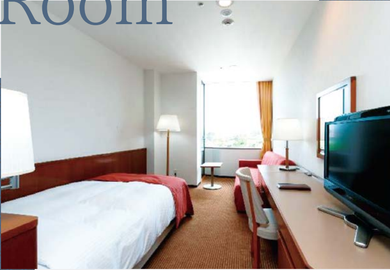
シングルルーム一例